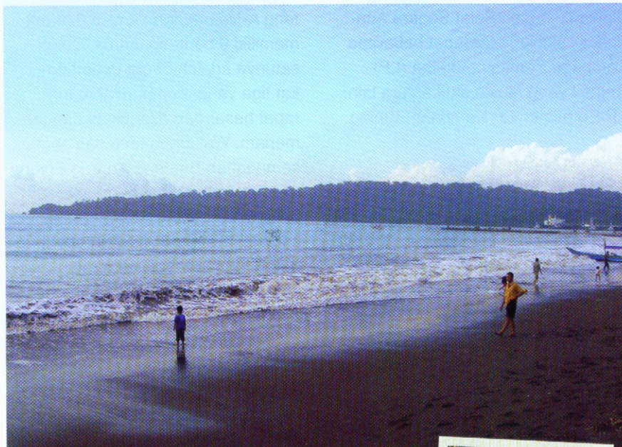
Pantai Teluk Penyus, indah bukan?

Jangan khawatir ketika lapar di pantai terdapat restoran-restoran seafood yang menyajikan masakan hasil laut yang lezat, seperti ikan bakar, cumi-cumi asam manis, dan lain-lain. Jika Anda ingin membeli oleh-oleh untuk keluarga atau teman, di sepanjang pantai juga terdapat kios-kios penjual ikan asin dan basah yang siap dimasak atau aneka souvenir kerajinan keramik.