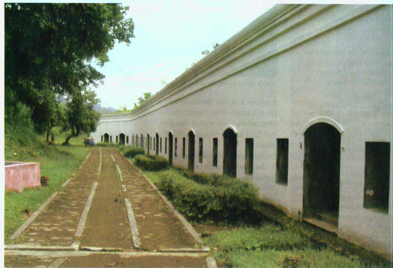
Benteng Pendem Masih terlihat